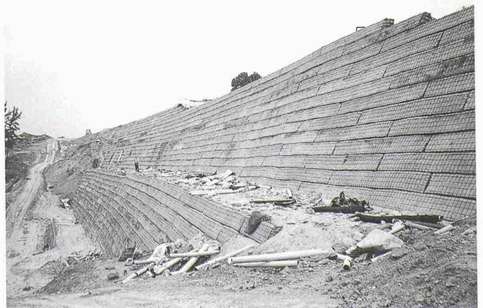
1 Ansicht der fertig erstellten Stützwand von 28 m Höhe an der Autobahn bei Ponferrada, Spanien

Die Hauptaufgabe des Planers besteht wie bei anderen Grundbauberechnungen im Festlegen der Bodenkennwerte, der Bemessungsmethode und der erforderlichen Sicherheitswerte. Gerade im Grundbau sind jedoch diese drei Gruppen von Ausgangsdaten wegen der stark unterschiedlichen Genauigkeit und dem Differenzierungsgrad der Berechnungsmethoden sowie den dazu angemessenen Sicherheitsvorgaben oft voneinander abhängig. Bei Geotextilmauern beziehen sich die Si-