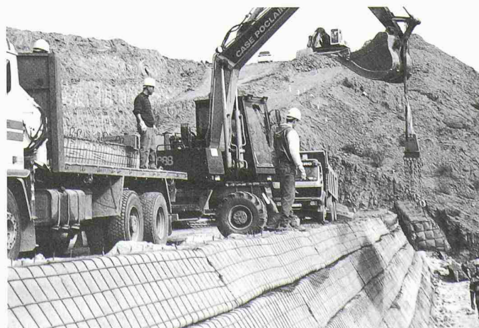
3 Montage der Gabionen mit dem Einbaukran direkt vom Camion, eine besonders schnelle und effiziente Methode

Beim Projekt in Spanien wurde die gesamte Aushubfläche mit einer neuartigen und relativ dünnen Drainagematte abge-