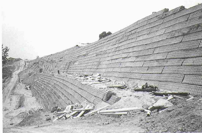
1 Ansicht der fertig erstellten Stützwand von 28 m Höhe an der Autobahn bei Ponferrada, Spanien

Die Hauptaufgabe des Planers besteht wie bei anderen Grundbauberechnungen im Festlegen der Bodenkennwerte, der Bemessungsmethode und der erforderlichen Sicherheitswerte. Gerade im Grundbau sind jedoch diese drei Gruppen von Ausgangsdaten wegen der stark unterschiedlichen Genauigkeit und dem Differenzierungsgrad der Berechnungsmethoden sowie den dazu angemessenen Sicherheitsvorgaben oft voneinander abhängig. Bei Geotextilmauern beziehen sich die Si-