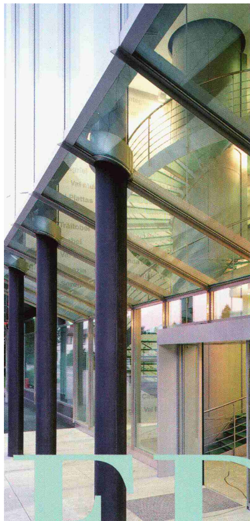
Die dreigeschossige Eingangshalle, transparentes Herzstück des neuen Verwaltungsgebäude der EWBO/OES AG, Illanz. Architekt: Jakob Moutalpa.