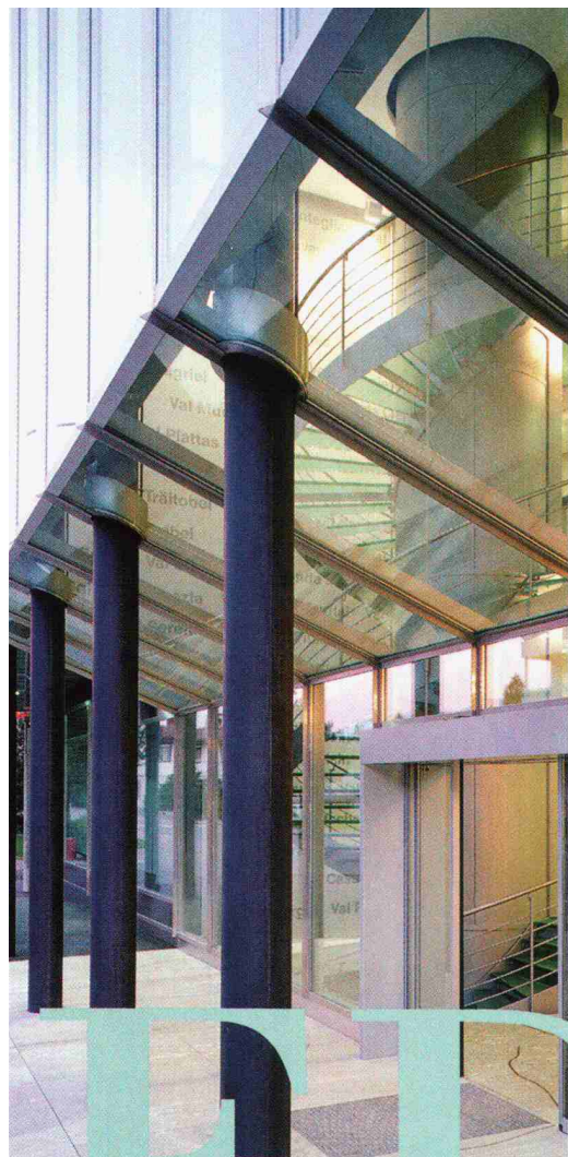
Die dreigeschossige Eingangshalle, transparentes Herzstück des neuen Verwaltungsgebäude der EWBO/OES AG, Illanz. Architekt: Jakob Mollath.