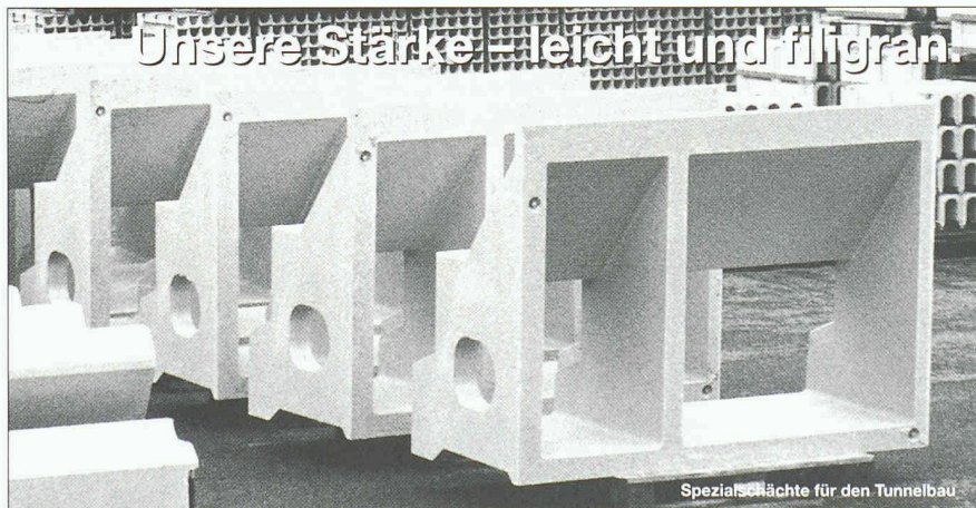
Spezialschächte für den Tunnelbau

Polycryl fabriziert Bauelemente aus Polymerbeton. Und dies tun wir ganz nach Ihren Wünschen und Ansprüchen. In der Realisation objektspezifischer Individuallösungen liegt unsere besondere Stärke.