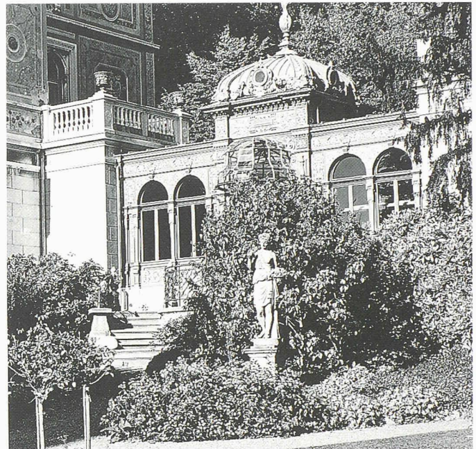
Blick auf den Haupteingang der Villa Patumbah, Zürich. Sie wurde in enger Zusammenarbeit zwischen Bauherrschaft, Denkmalpflege, dem Architekten und den Handwerkern sorgfältig restauriert

Im Auftrag der Denkmalpflege untersuchte die Firma Jakob Scherrer Söhne AG im Jahr 1995 die alten Ornamentblecharbeiten und erstellte einen Sanierungsbericht. Die in Zusammenarbeit mit dem Architekten, der Denkmalpflege und der Empa angestellten Unter-