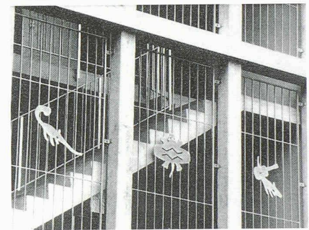
Musikerwohnhaus der Stadt Zürich von Miroslav Šik und Daniel Studer (oben), Musiktire von Roland Fässer (unten)