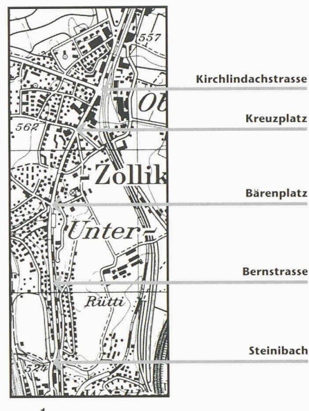
1 Situation Bernstrasse. Reproduziert mit Bewilligung des Bundesamtes für Landestopographie vom 16.9.97

Personenunterführungen in den sechziger Jahren, noch mit der Verlegung der BZB konnten die wachsenden Verkehrs- und Immissionsprobleme gelöst werden. Von kurzer Dauer war auch die Entlastung der Bernstrasse nach der Eröffnung der Grauholzautobahn 1962. Die inzwischen auf 20 000 Fahrzeuge pro Tag angestiegene Verkehrsbelastung führte zu Staus mit hohen Lärm- und Abgaswerten. Die Bernstrasse wurde zum fast hoffnungslosen Fall und zum Politikum. Der Gemeinderat ergriff die Initiative und setzte 1986 die «Kommission Bernstrasse» ein. Der Kanton Bern reagierte wenig später mit der Neuplanung der Ortsdurchfahrt Zollikofen.