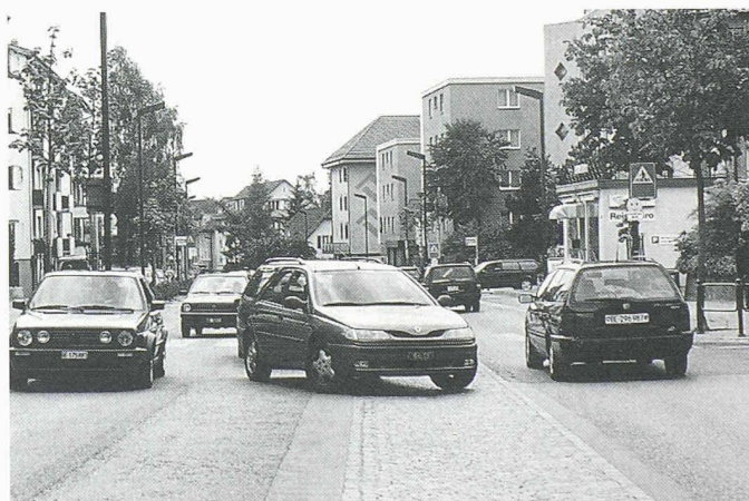
Mehrzweckstreifen erlaubt Abzweigen ohne Behinderung

kofen geworden. Am Kreiseldurchmesser Bärenplatz haben die zur Bahnstation eilenden Fussgängerinnen und Fussgänger Oberhand gewonnen. Solche, die am Rotlicht der Signalanlage wartend verärgert den Zug abfahren sehen, gehören der Vergangenheit an.