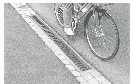
Veloverkehr: Zum Ausweichen auf das Trottoir ist der Übergang flach gestaltet