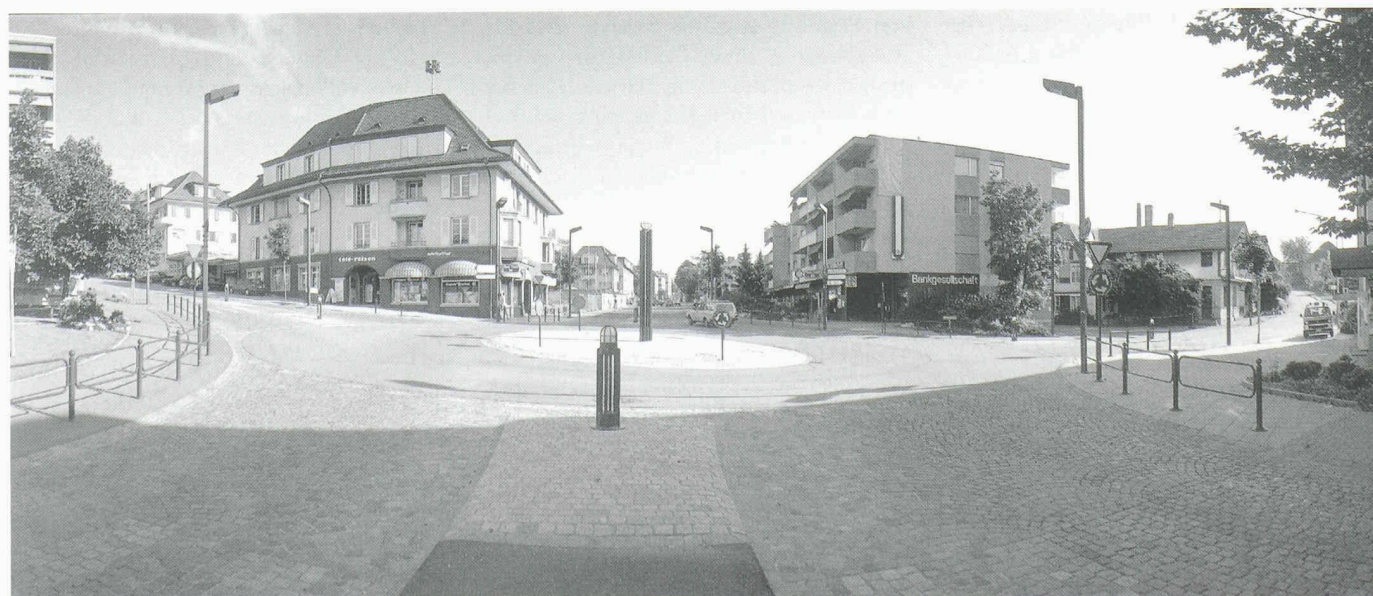
Aus Strassenkreuzung wird Bärenplatz, Kreiseldurchmesser: 28 m