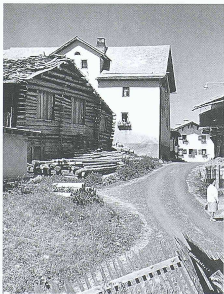
Umnutzungs- oder Neunutzungsmöglichkeiten sind auch inmitten vieler Bergdörfer und Weiler nötig, um eine lebensfähige Gemeinschaft zu erhalten

Ob es den einen nun passt und anderen überhaupt nicht, der Wandel unserer alten Kulturlandschaften – und hier seien vor allem die Berggebiete ins Visier genommen – ist weder aufzuhalten und schon gar nicht rückgängig zu machen. Im Tessin streitet man sich um Hunderte von ungesetzlich umgestalteten Rustici in Ferienhäuser, im Wallis gibt es jede Menge von nicht mehr gebrauchten Spychern und Heuställen und in fast allen Bergkantonen Maiensässe, die nicht mehr benutzt werden. Obwohl wir alle merken, wie unsere Welt sich von Jahr zu Jahr rasant verändert, haben viele unter uns, und wohl vor allem ältere Menschen, Gefühle des Verlustes, wenn sie ihre Heimat betrachten und sich bewusst werden, was an Altvertrautem alles verschwunden oder ganz nutzlos geworden ist. Da tauchen natürlich Fragen auf wie: Ist das richtig und nötig, wer ist dafür verantwortlich, muss und kann man hier Riegel schieben?