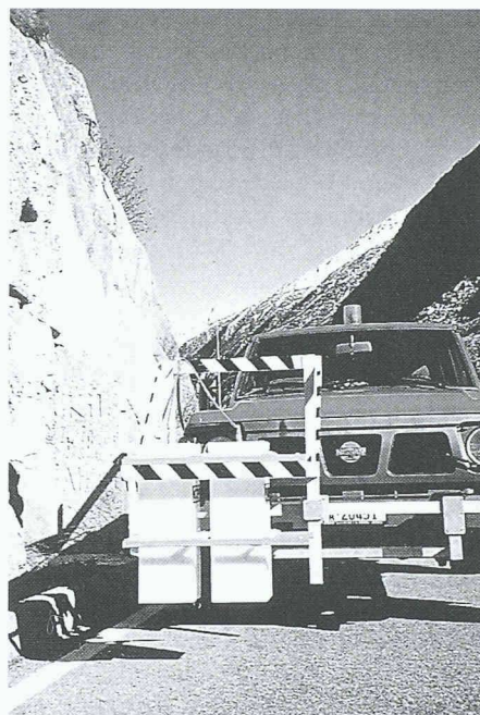
Mobile Georadaranlage im Einsatz

Das Verfahren beruht auf einem elektromagnetischen Signal, das von einer Antenne abgestrahlt wird. Es dringt in das untersuchte Objekt ein und wird an Grenzflächen, wie beispielsweise der Unterseite