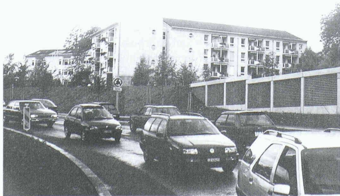
1 Traditioneller Lärmschutz: Lärmschutzwände und Lärmschutzdämme

Im Kanton Zürich wurden in den letzten Jahren zahlreiche Lärmsanierungen durchgeführt, insbesondere entlang der Autobahnen. Noch immer leben aber 70 000 Menschen mit einer Lärmbelastung über den Grenzwerten. Der Gesamtsanie-