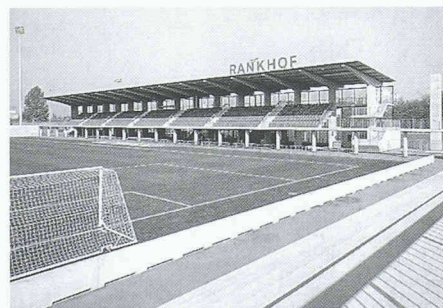
Fussballstadion Rankhof, Basel Architekten: Michael Alder + Partner, Basel