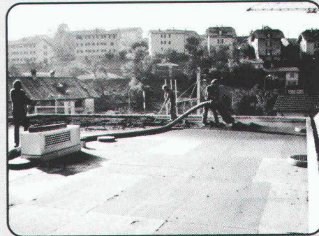
Begrünen von Flachdächern, Dachgärten und Böschungen.