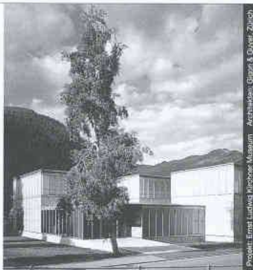
Projekt: Ernst Ludwig Muthose Museum Architekt: Gigot & Düry, Zürich

Ästhetik, Wirtschaftlichkeit und bauphysikalische Anforderungen in Einklang zu bringen, ist das Ergebnis ausgereifter Konstruktionen. Qualitätsbewusstsein und partnerschaftliche Zusammenarbeit sind nur einige der Voraussetzungen für ein gutes Gelingen in dieser vielfältigen Branche.