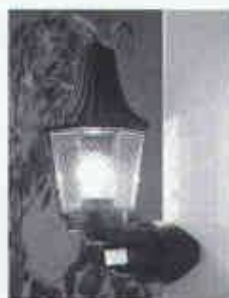
Swiss Lampe 200° Eckmontage