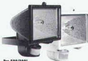
Pro 500/200* E-No. 924 602 019