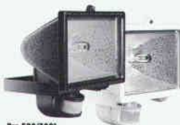
Pro 500/200° E-No. 924 602 019