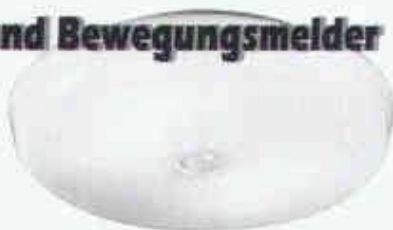
Cerclampe 360* Deckenmontage E-No. 913 721 609