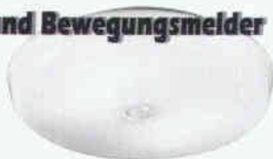
Cerclampe 360° Deckenmontage E-No. 913 721 609