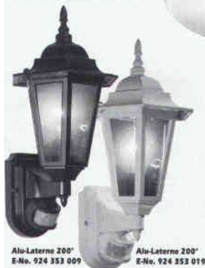
Alu-Laterne 200° E-No. 924 353 009