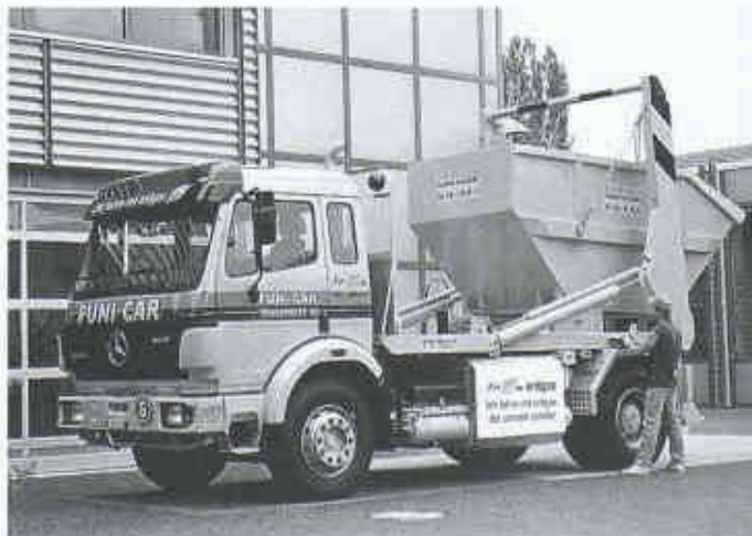
Seit Juli 1996 verkehrt in Biel der erste erdgasbetriebene Muldenkipper der Schweiz

In der Schweiz zirkulieren heute bereits über 60 Erdgasfahrzeuge; darunter zwölf Busse in Basel, mehrere Lastwagen und ein Kehrtraktor. Die Fahrzeug-