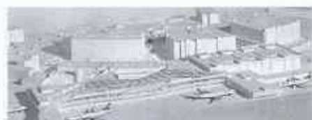
Bilder von oben nach unten:

Flughafen Zürich, November 1948, kurz vor der Inbetriebnahme