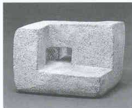
Lurra, Projekt für eine Granitskulptur, 1989, 16 x 23 x 18 cm

schwarze Bemalung mit Kupferoxyd geheimnisvoll ummantelt werden. Ton, für Chillida schlechthin «Erde», ist auch dem Feuer verbunden. Die ungefärbten Stücke werden in einem Holzofen bei Temperaturen um 1350°C sehr behutsam rund 24 Stunden lang gebrannt. Skulpturen mit Kupferoxyd kommen nach dem Auftrag der Engobe ein zweites Mal in einen Elektroofen.