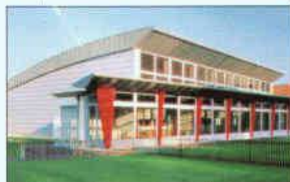
Ausführung in QUARTZ-ZINC und ANTHRA-ZINC

Wir begleiten Sie, unseren Partner, von der Konzeption bis zur Realisation: mit Hilfestellung