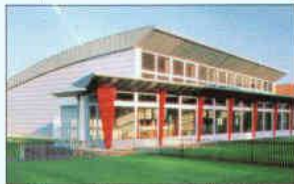
Ausführung in QUARTZ-ZINC und ANTHRA-ZINC

Wir begleiten Sie, unseren Partner, von der Konzeption bis zur Realisation: mit Hilfestellung