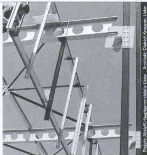
Projekt: Altbau-Hauptkammerhalle, Luzern Architekt: Dietrich Krappeler, Udler

Nur mit diesem Baustoff sind die grössten Spannweiten und Höhen möglich, dies mit Berücksichtigung der Wirtschaftlichkeit und des vorteilhaften Leistungsgewichtes. Stahl bietet eine nahezu unerschöpfliche Fülle von Möglichkeiten, ihm lokals zu verwirklichen.