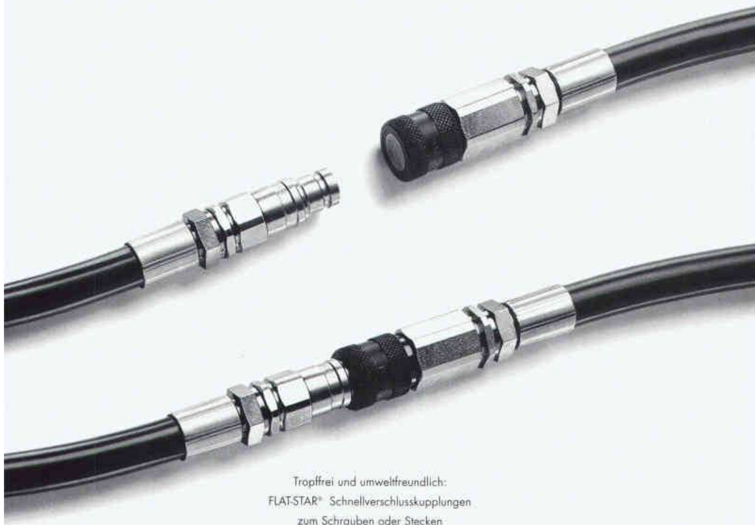
Tropffrei und umweltfreundlich: FLAT-STAR® Schnellverschlusskupplungen zum Schrauben oder Stecken

Überall, wo Leitungen mit hohem Systemdruck und unter harten Umgebungsbedingungen angeschlossen und getrennt werden müssen, erweisen sich FLAT-STAR® Kupplungen als die beste Lösung – nicht zuletzt auch für die Umwelt, weil kein Tropfen daneben geht. Sie eignen sich für eine Vielzahl von Anwendungen: im Werkzeugmaschinen- und