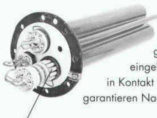
Die Heizelemente sind in Schutz- rohren eingebaut

eingebaut, kommen deshalb nie in Kontakt mit dem Wasser und garantieren Nachtruhe.