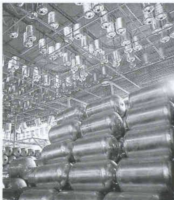
Blick auf die Produktionskette

Was bedeutet der Ausdruck ISO 9001 für Sie?