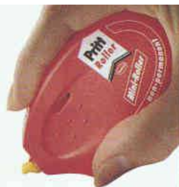
Der Pritt Kleberoller non-permanent

Pritt Kleberoller gibt es auch mit Refill-Kassette