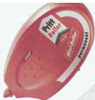
Pritt Kleberoller permanent