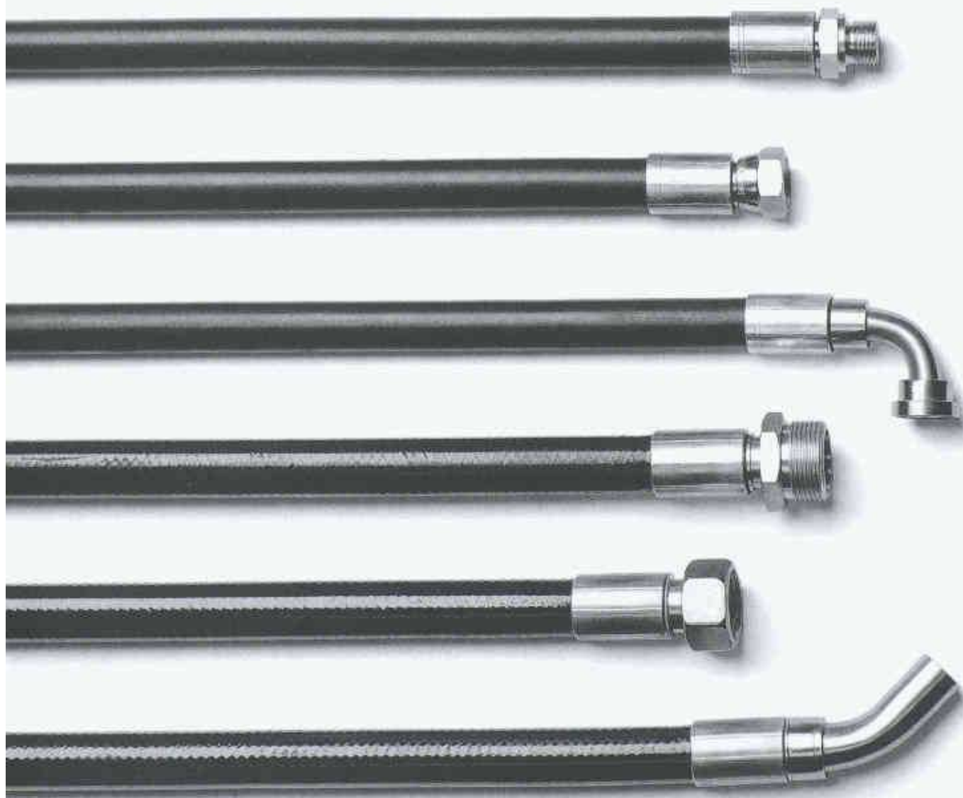
Flexible Schlauchleitungen HYDROFLEX® und FLEXITREL® als individuelle Komponente lieferbar

Im Erfüllen individueller Kundenwünsche sind wir mindestens so vielseitig wie diese Schlauchleitungen.