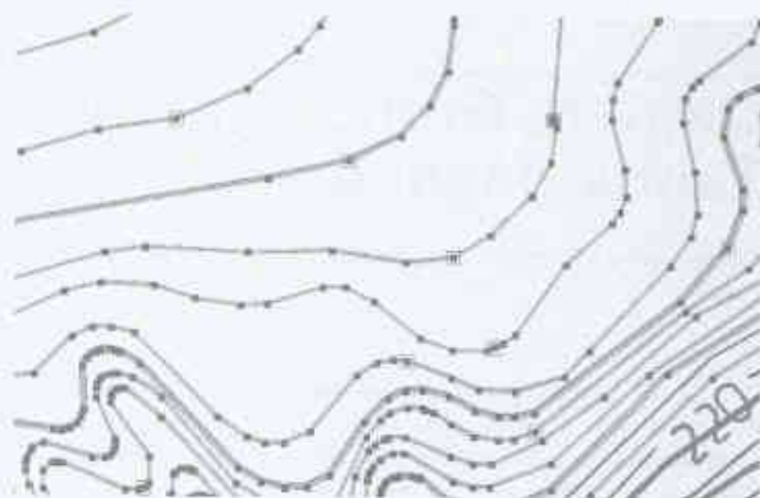
2 «Intelligente» Vektorisierung