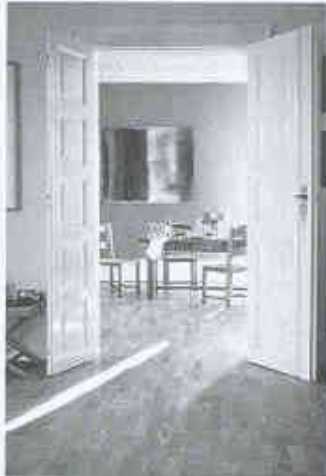
Wicanders AG zeigt Naturböden

Gebäude Tobler AG 8902 Udorf Tel. 01/735 50 00 Halle 1, Stand 141