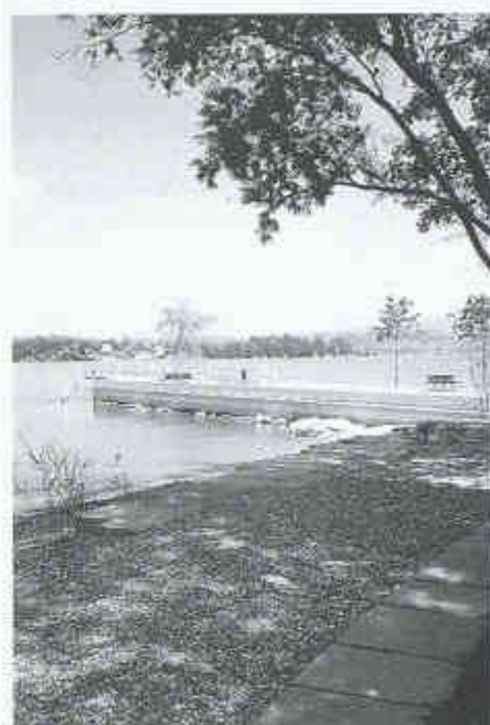
Halbinsel mit Schiffssteg

Vorstand der SGGK ist überzeugt, dass diese Anlage eine Auszeichnung verdient.