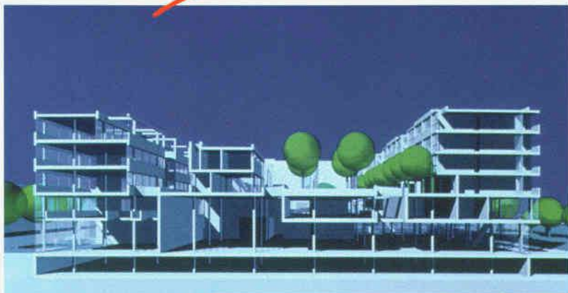
Projektwettbewerb 1. Preis Pankow Center Nord, Berlin