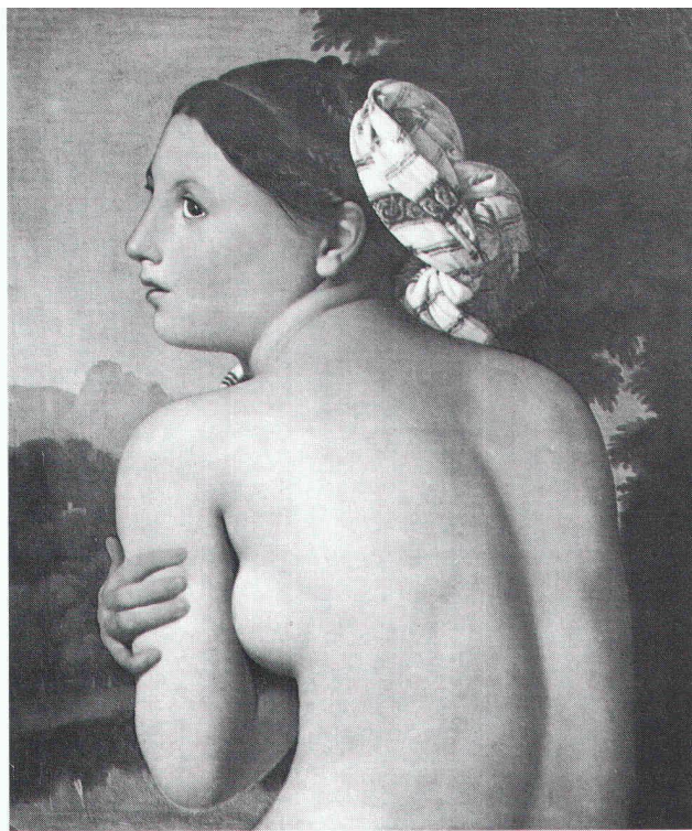
"La Baigneuse" Ingres, 1807