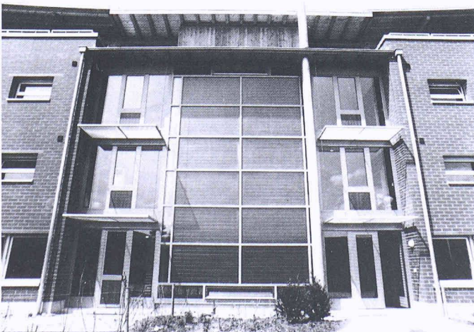
Solarpreis 1994. Mehrfamilienhaus in Murten; Architektin: Ursula Willenegger-Röthenmund