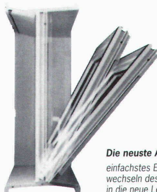
Die neueste ACO-Entwicklung: einfachstes Einsetzen und Aus- wechseln des Fenstereinsatzes in die neue Leibung.

Wir bieten Ihnen Problemlösungen speziell im Leibungsfensterbereich mit einem Werkstoff der Zukunft. Polymerbeton hat sich dank seinen hervorragenden Eigenschaften vielfach bewährt und löst in immer weiteren Bereichen der Bauwirtschaft herkömmlich eingesetzte Werkstoffe und Verfahren erfolgreich ab. Die ACO als führender Hersteller mit eigenem Werk in Netstal GL hat es sich zum Ziel gesetzt, ihre Position als Marktleader mit laufenden Produkte-Innovationen und kunden-gerechten Dienstleistungen zu festigen. Dies erreichen wir mit unseren qualifizierten und motivierten Mitarbeitern , die das individuelle Lösen der Kundenanforderungen ins Zentrum ihrer Überlegungen stellen. Gerade in der heutigen Zeit ist es enorm wichtig, die Kosten-Nutzen-effizienteste Lösung aufzeigen und anbieten zu können. Das ACO MARKANT® Leibungsfenster ist ein System mit Leibungen, verschiedenen Fenstereinsätzen und Lichtschächten, das von Ihnen individuell zusammengestellt werden kann. Sie wollen mehr über die Vorteile von Polymerbeton und weitere effiziente Problemlösungen erfahren? Dann rufen Sie jetzt gleich an!