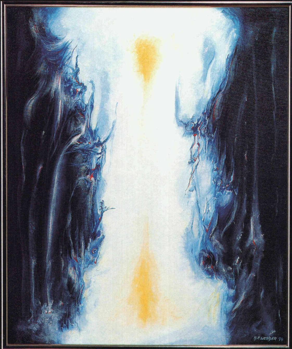
H.P. Werder «Durchbruch», Oel auf Leinwand

Badstrasse 36 5312 Döttingen Telefon 056 45 70 77 Telefax 056 45 70 33