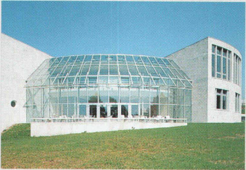
Weiterbildungszentrum HSG, St.Gallen