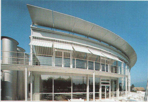
DOW Europe SA, Horgen