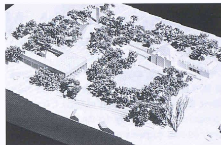
1. Rang. Dachtler Architekten AG, Horgen