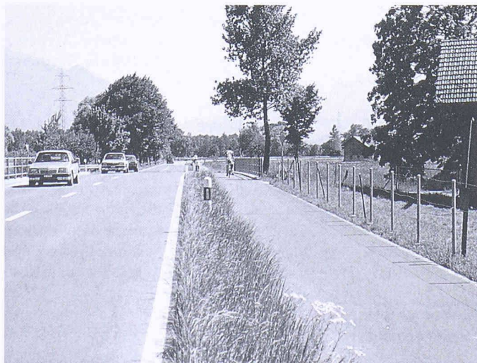
Bei der Melioration Sennwald konnte der Boden für den Radweg eigentumsässig ausgeschieden werden

Rudolf Weidmann, Meliorations- und Vermessungsamt des Kantons St.Gallen, Davidstr. 35, 9001 St.Gallen.