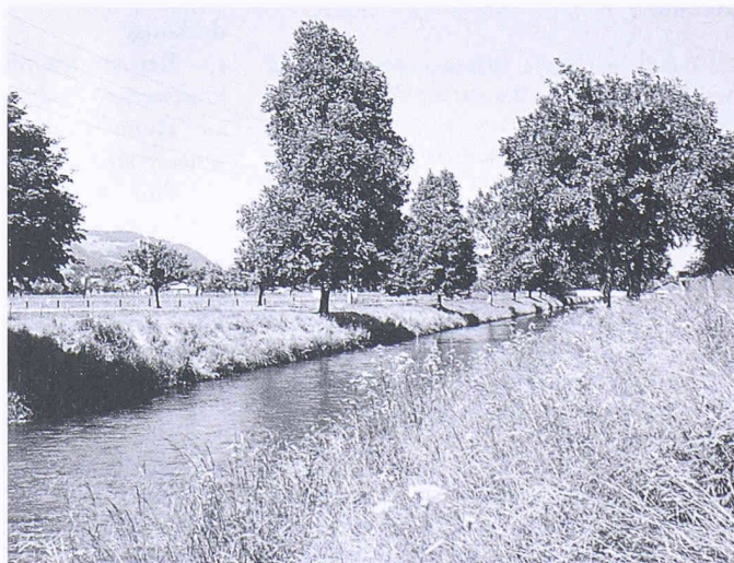
Die Magerwiesenstreifen dienen als Trenngürtel zum ackerbaulich genutzten Boden auf beiden Seiten des Kanals