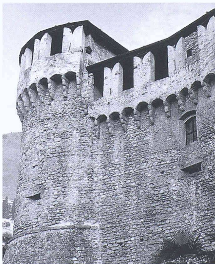
Castello Visconteo, Locarno TI