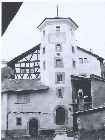
Landsitz «Mayorshof» in Leuk VS

Die letztjährigen Veranstaltungen sties- sen beispielsweise in Genf bei 17 000 Besuchern auf soviel Anklang, dass die «Journées et Nuit du Patrimoine» am 9./10. September wiederum durch ein Abendprogramm in Stadtzentrum bereichert werden. Neben Burgen und Schlössern werden am Samstag in Genf auch die Architektur der Kinosaale sowie Objekte in Restauration vorgestellt. Am Sonntag will man auf Stadtrundgängen die Entwicklung des rechten