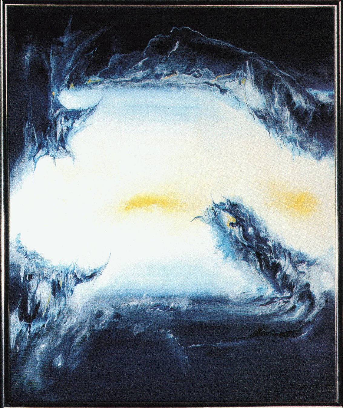
H.P. Werder «Dynamischer Zug», Öl auf Leinwand

schiedelkamin® schiedelkamin® schiedelkamin® schiedelkamin®