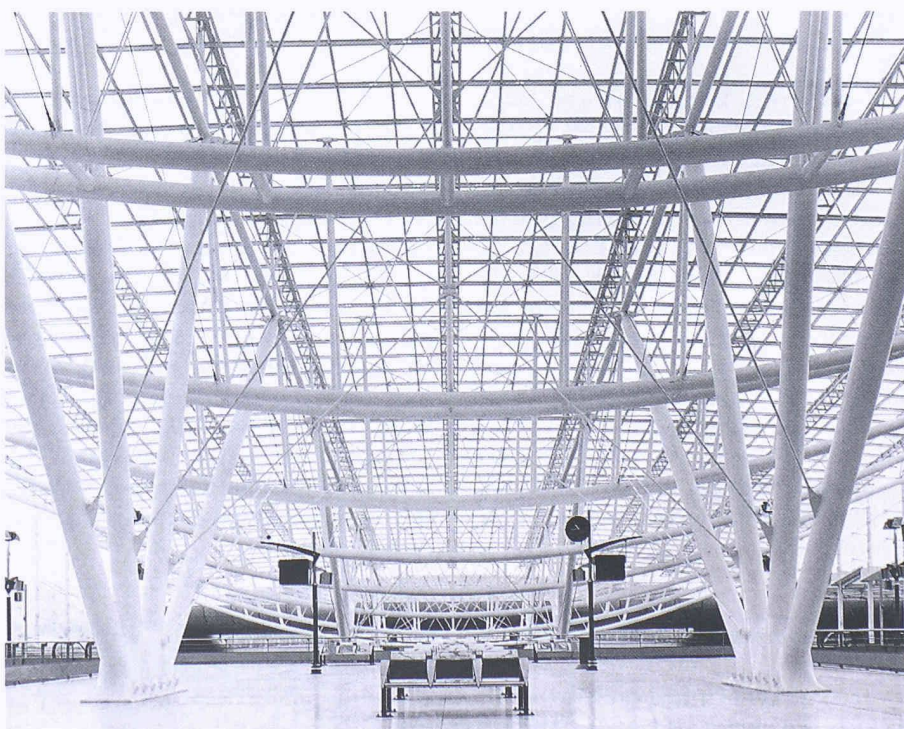
Bild 3. Riesige, aufgefächerte Stahlpylonen tragen die Elemente der Überdachungskonstruktion, die im oberirdischen Teil schräg ansteigt

Das Konstruktionsprinzip ist einfach, die Ausgestaltung äusserst raffiniert und komplex, vor allem in den beiden oberirdisch ansteigenden Gebäudeteilen rechts