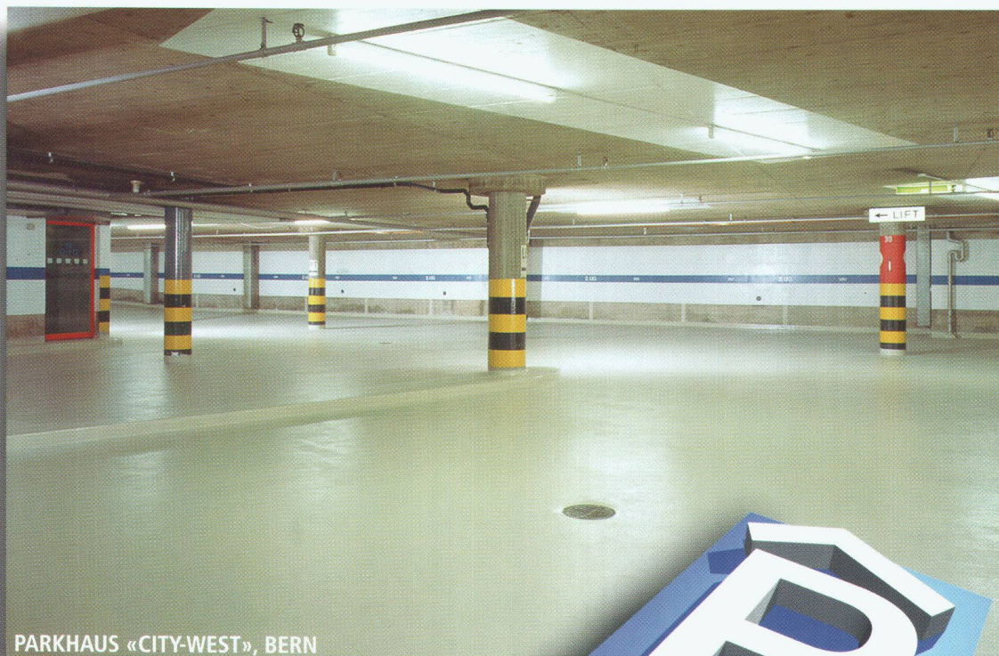
PARKHAUS «CITY-WEST», BERN