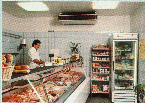
z.B. in Ladenlokalen