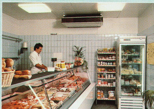
z.B. in Ladenlokalen