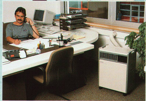
z.B. in Büro- oder Wohnräumen