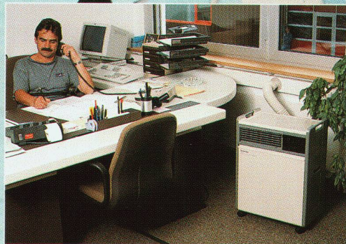
z.B. in Büro- oder Wohnräumen