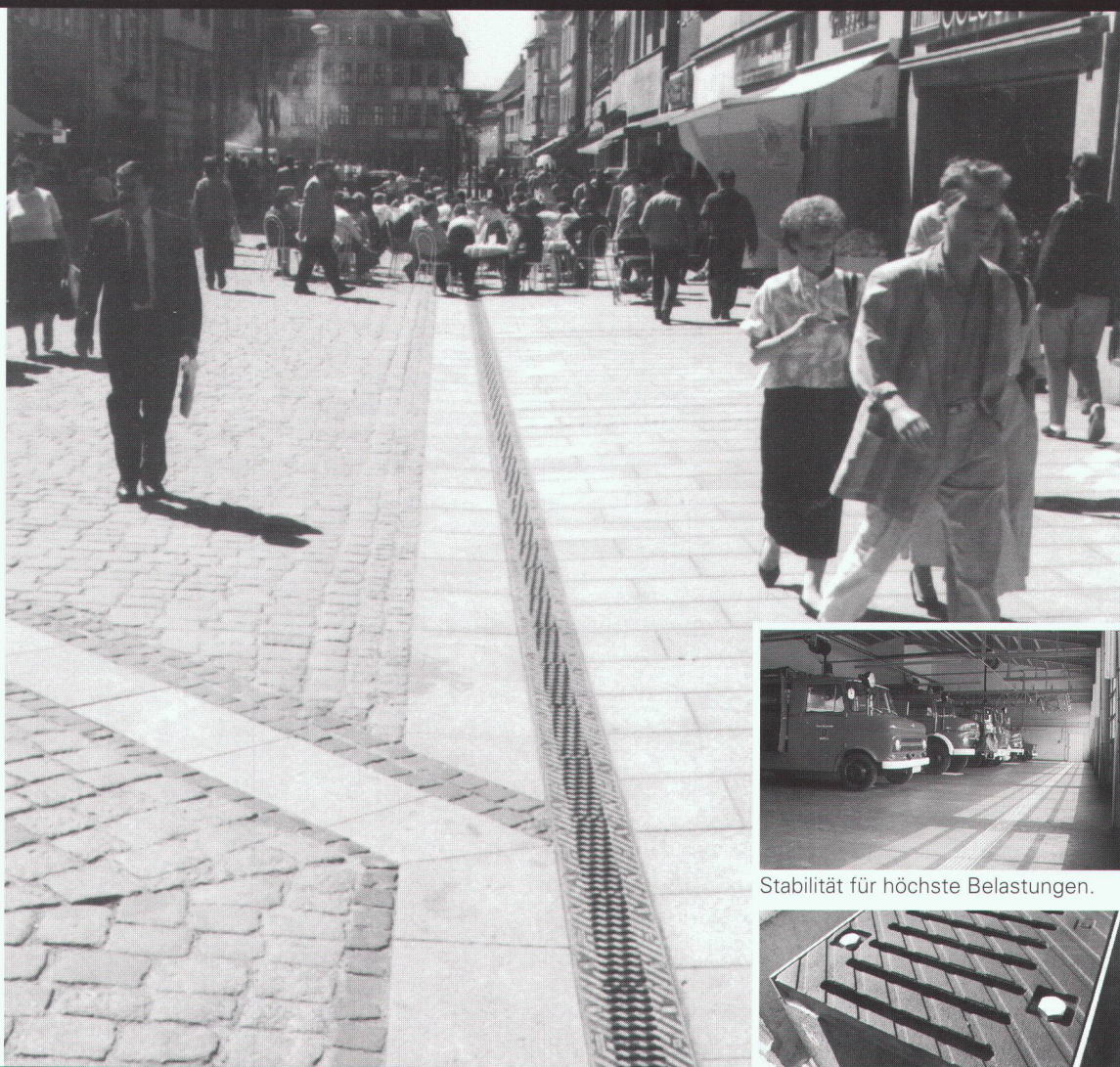
Stabilität für höchste Belastungen.