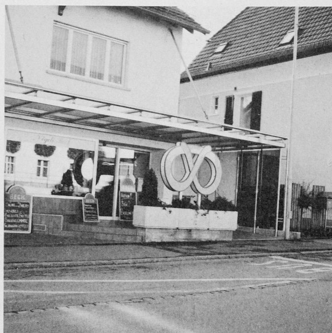
Unterstand aus Edelstahl und Glas in Wangen bei Olten

Zettler AG 5032 Rohr/Aarau Tel. 064/22 70 71