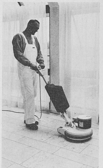
Das Sorma-Marble-Shine-System ist wesentlich effizienter als traditionelle Schleiftechniken