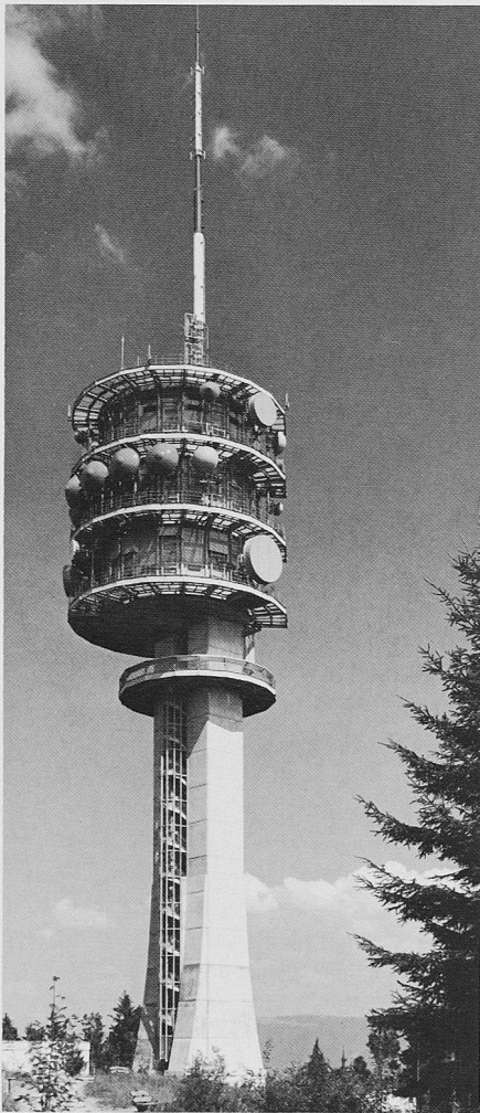
Auf dem Mont Gibloux im Kanton Freiburg entstand ein neuer Pfeiler im nationalen Fernmeldenetz, ein Bauwerk mit gut durchdachter Architektur (Bild: Noël Aeby)

(pd) Er gilt als weiterer Pfeiler im nationalen Richtfunknetz, der neue, 118 m hohe Telecom-Turm auf dem Mont Gibloux im Kanton Freiburg. Aufgrund