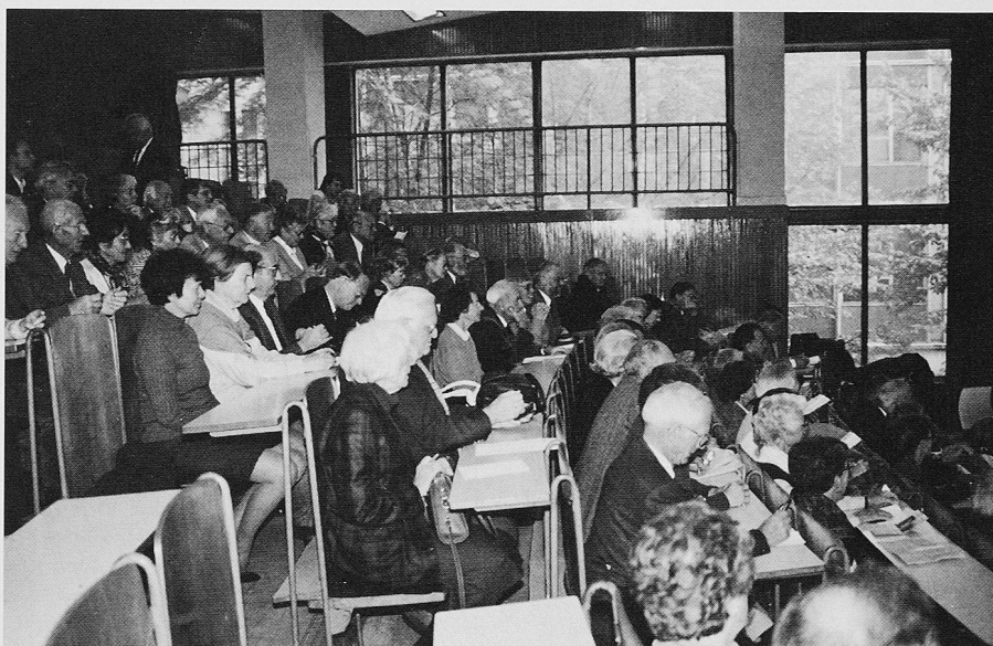
Die GEP-Delegation am Hochschultag an der Tschechischen Universität