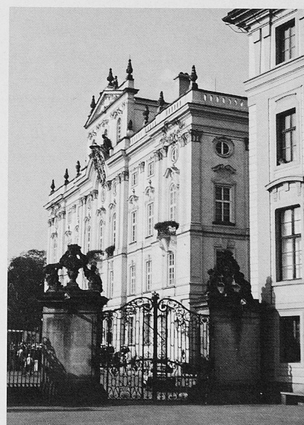
Eingang zum Hradšchin