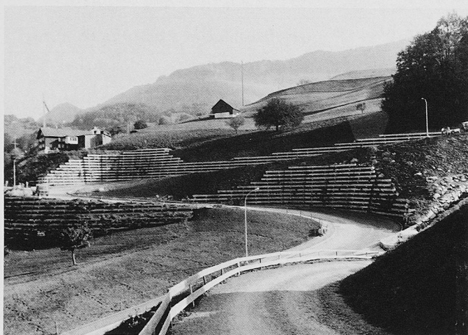
Bild 3. Ansicht der fertigmontierten Wände