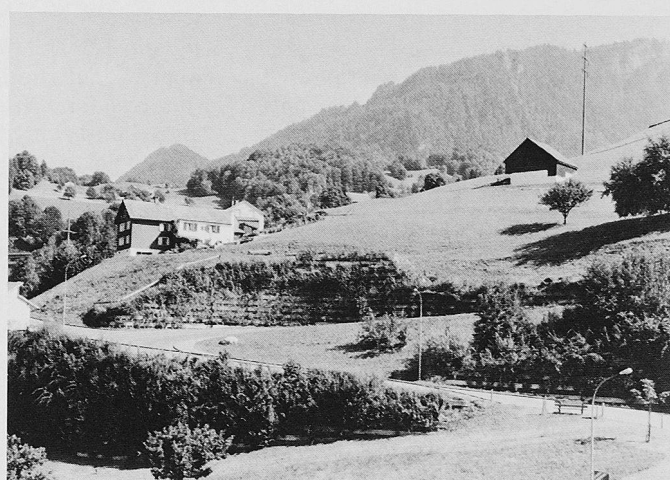
Bild 4. Ansicht der begrünten Wände nach drei Vegetationsperioden

Damit die Pflanzen optimal mit Regenwasser versorgt werden, wurde im Querprofil eine Wandneigung von 3:1 gewählt. Zudem sind die bis zu 10 m hohen Wandabschnitte mit einer 75 cm breiten Zwischenberme konzipiert.