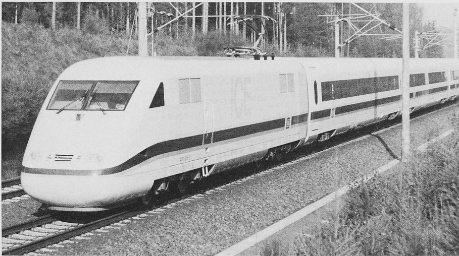
Der ICE der Deutschen Bahn hat erfolgreiche 1000 Tage Einsatz hinter sich

München und Berlin–München) dieser 1. Ausbaustufe.