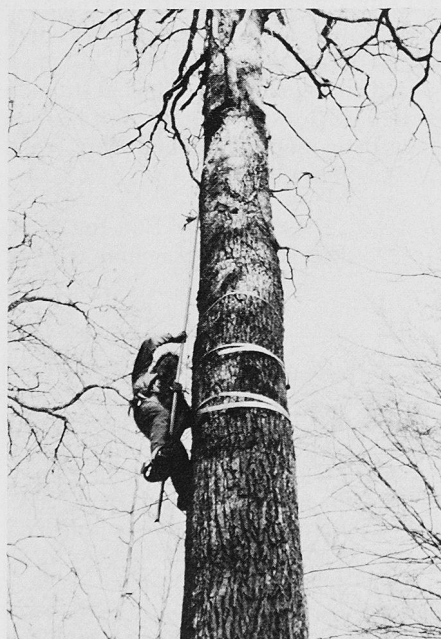
Schwierige Materialbeschaffung: Für die Analysen im Labor werden Nadeln und Knospen gesammelt

(DB) Innerhalb dreier Jahre entwickelte sich der ICE zum Flaggschiff der Deutschen Bahn. Zurzeit sind 60 Züge mit insgesamt 36 900 Sitzplätzen in Betrieb, und fast 65 000 Menschen benutzen diese Tag für Tag. Bis zu 40% mehr Reisende zählt man auf den drei ICE-Linien (Hamburg-Zürich, Hamburg-