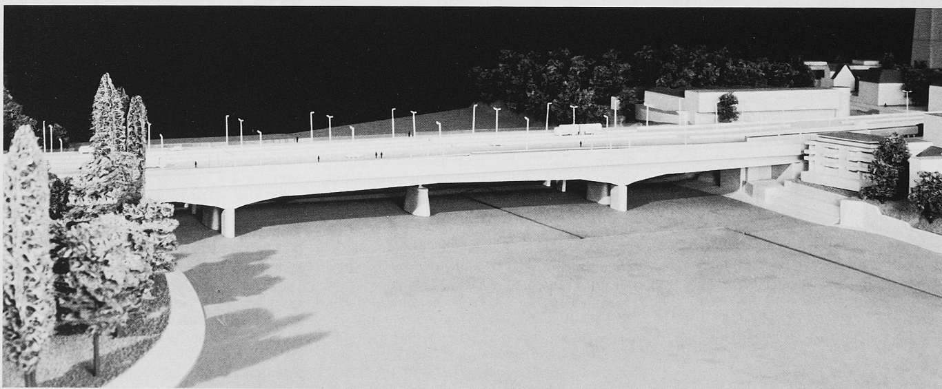
Zweite Rheinbrücke, Verbindungsbahn Basel SBB–Basel DB. 1. Preis, zur Weiterbearbeitung vorgeschlagen