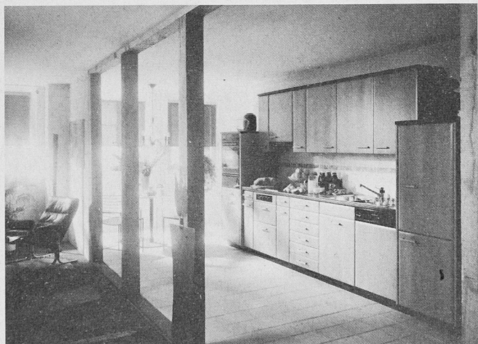
Piatti-Küche in Echtholz

Bruno Piatti AG 8305 Dietlikon Tel. 01/835 51 11