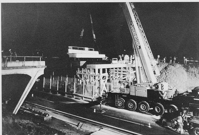
Bild 1. Abbruch der alten Brücke: Auftrennen des Mittelfeldes in sechs Teilstücke und Abheben mit Autokran