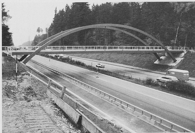
Bild 2. Ansicht der neuen Brücke in Richtung Zürich