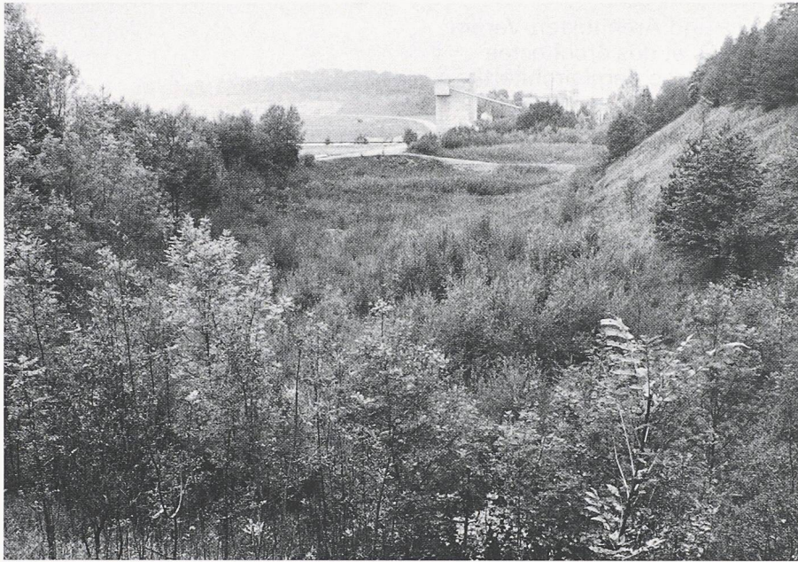
Speziell angelegte Kanäle begünstigen den Laichzug der Frösche im Nassbiotop in Mülligen

kultivierung des Kiesabbaugebiets Eichrütel im Bereich des früheren Absetzbeckens in enger Zusammenarbeit mit dem Aargauischen Bund für Naturschutz (ABN) ein Nassbiotop zu verwirklichen.