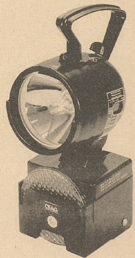
Handscheinwerfer SEB 5 N

Der Leuchtenkopf ist stufenlos verstellbar. Dank dem ergonomisch gestalteten Traggriff lässt sich der Schalter auch mit Sicherheitshandschuhen einhändig bedienen. Mit der orangen Rundlichtkappe dient der Handscheinwerfer als Warnblinkleuchte. Der Handscheinwerfer SEB 5 N ist harten Einsatzbedingungen gewachsen. Das Scheinwerferglas ist absolut kratzfest. Das robuste Gehäuse ist aus hochwertigem, schlagzähem Kunststoff gefertigt.