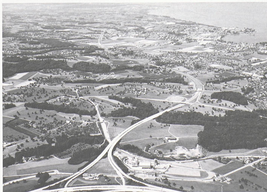
Nach fast 5jähriger Bauzeit konnte jetzt der knapp 8 km lange N1-Zubringer von Arbon TG dem Verkehr übergeben werden. Dadurch wird dem Bodensee entlang eine spürbare Verkehrsentslastung erwartet

Seit Beginn des Nationalstrassenbaus 1959 hat der Bund rund 29,8 Mia. Fr. für