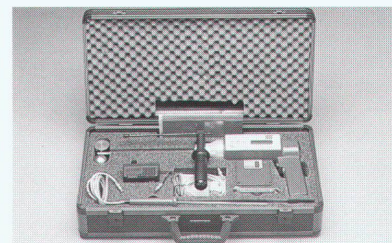
Gerät mit Zubehör im handlichen Koffer.