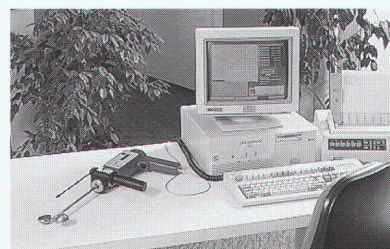
PC-Anschluss garantiert belegbare Betonqualität.