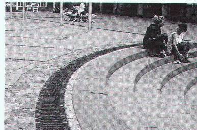
Ästhetik in verkehrsfreien Zonen