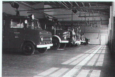
Stabilität für höchste Belastungen