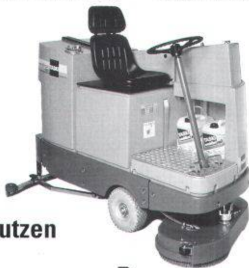
Der TASKI combimat 4000 wurde anlässlich der EUROPROPRE mit dem 1. Preis für Innovationen ausgezeichnet.